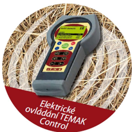
Elektrické ovládání TEMAK Control